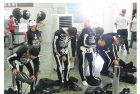
Na alegoria do Sindicato, bancários chegam felizes para o trabalho, mas o que sobra é apenas a caveira, após a exploração diária

CAMPANHA NACIONAL 2015: Principais reivindicações Página 2