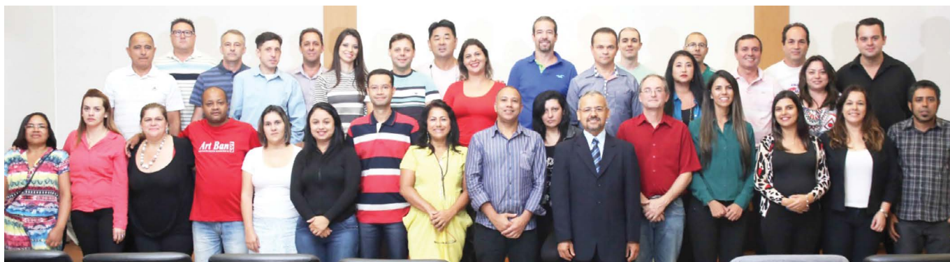
Integrantes da Chapa Unidade, Diversidade e Democracia - CUT

A Chapa Única “Unidade, Diversidade e Democracia” obteve 919 dos 934 votos recolhidos na eleição para composição da nova diretoria do Sindicato dos Bancários de Guarulhos e Região. A entidade, filiada à Central Única dos Trabalhadores – CUT congrega bancários das cidades de Guarulhos, Itaquaquecetuba, Arujá, Ferraz de Vasconcelos e Mairiporã. 2 votos foram anulados, além de 13 em branco.