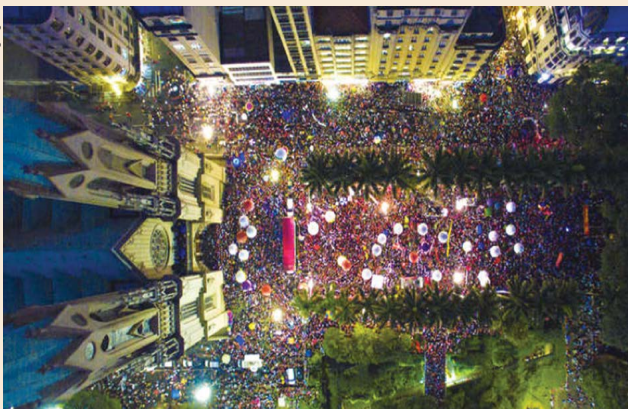
Praça da Sé, 31/03/16. Povo fazendo história!

Tempos confusos, tempos de crises, tempos de resistência. No dia 31 de março de 2016 a população mais uma vez foi às ruas em todo o Brasil e diversas outras partes do mundo para dar um recado muito claro aos que almejam obscuras viradas de mesa: NÃO VAI TER GOLPE, VAI TER LUTA! Nada melhor do que travar essa batalha nesta emblemática data, quando em 31 de março de 1964 os golpistas da época jogaram mais de 20 anos de trevas e atrasos no país com a instalação da ditadura (nunca mais!).